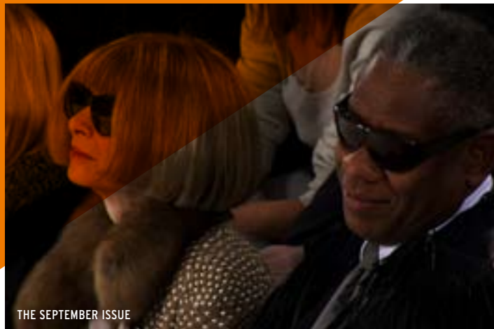
THE SEPTEMBER ISSUE

Documentaire waarin Vogues befaamde hoofdredactrice Anna Wintour gevolgd wordt tijdens de voorbereidingen van het belangrijke septembernummer van Vogue. In het hoofdkwartier in Manhattan, maar ook bij photoshoots in Parijs en Rome demonstreert Wintour haar beruchte bikkelharde leiderschap.